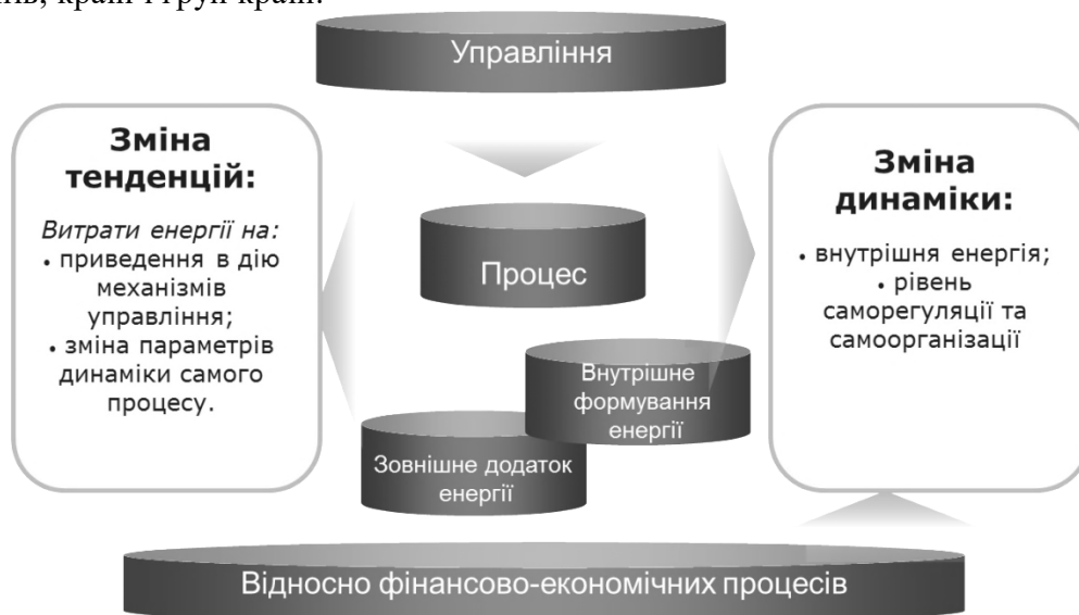
Рис. 4. Енергетичні витрати процесу управління

Управління будь-яким процесом здійснюється шляхом впливу на нього з метою зміни ходу процесу в потрібному напрямку. Зміна ходу процесу, наприклад, зміна його напрямку, прискорення або уповільнення, вимагає витрат енергії, по-перше, на приведення в дію механізмів управління, по-друге, на зміну параметрів динаміки самого процесу. У більшості випадків інші витрати набагато перевищують перші, але зміна динаміки процесу можливо як за рахунок зовнішнього підведення енергії, так і за рахунок його внутрішньої енергії (рис. 4).