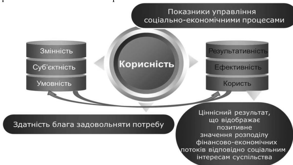
Рис. 1. Схематичне відображення трансформації корисності соціально-економічних процесів

Виклад основного матеріалу дослідження. Соціальна користь, як критерій соціально-економічної ефективності, є показником завжди умовним, суб'єктивним і виражається через універсальні вартісні елементи [8]. Соціальна користь результатів людської діяльності проявляється тільки на стадії їхнього споживання, тому розмір доходу або прибутку, отриманий на стадії виробництва або реалізації продукції, не може свідчити про економічну ефективність, а тим більше про соціальну корисність відповідних результатів (рис. 1).