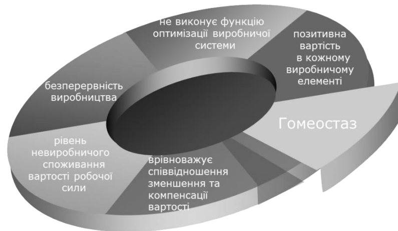
Рис. 4. Категоризація гомеостазу виробничої системи

Тому спонукальним мотивом реагування на кінцевий результат виробництва є величина саме невиробничого споживання частини вироблених продуктів. Ця мотивація через систему законодавчих, фінансово-економічних та адміністративно-технічних механізмів, в кінцевому рахунку, реалізується в виконавчу дію зміни параметрів виробництва. А це, в свою чергу, змінює величину споживання матеріальних благ.