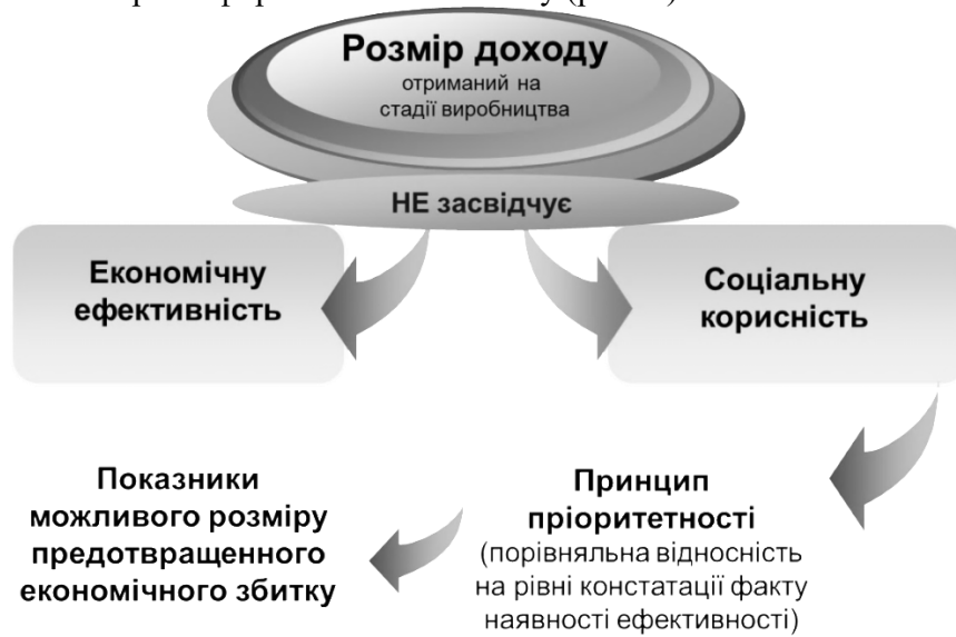
Рис. 2. Варіативність кількісного оцінювання соціальної корисності

констатації самого факту наявності ефективності або через показники можливого розміру предотвращеного економічного збитку (рис. 2).