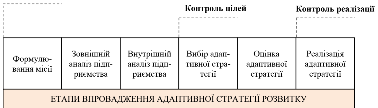
Рисунок 3 – Рівні контролю при формуванні адаптивної стратегії розвитку підприємства малого бізнесу